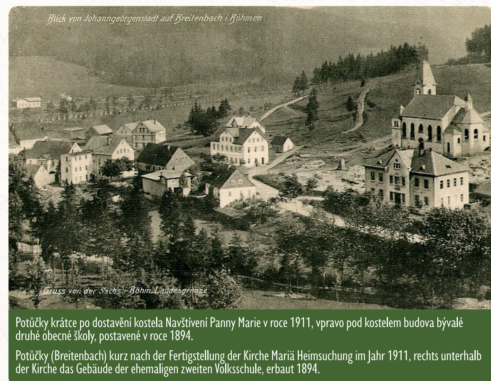
Blick von Johanngeorgenstadt auf Breitenbach i. Böhmen

Die alte Eisenhütten-tradition von Potůčky wurde im 19. Jahrhundert von der Firma Nestler & Breitfeld (später Eisenwerke Erla) fortgeführt, die nach dem Kauf des Hammers in Wittigsthal und einer Reihe anderer Betriebe in Sachsen auch eine Gießerei in Potůčky am Ende des 19. Jahrhunderts errichtete. Besonders bekannt wurde dieses Unternehmen, in dem 200 Mitarbeiter arbeiteten, durch die Herstellung dekorativer Vulkan-Gussöfen. Die Gießerei war bis 1946 in Betrieb und später nochmals in den Jahren 1959 bis 1981. In der Zwischenzeit wurden die Gebäude vom Staatsbetrieb Jáchymovské doly für die Lagerung und Aufbereitung von Uranerz genutzt.