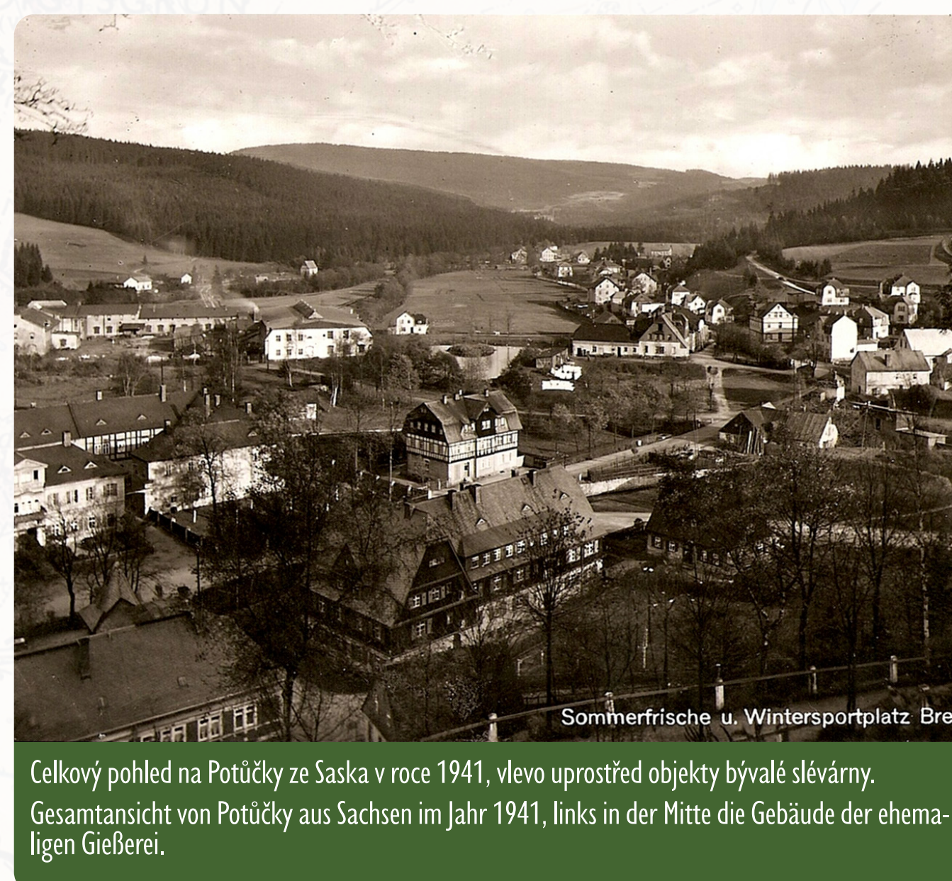
Sommerfrische u. Wintersportplatz Breitenbach