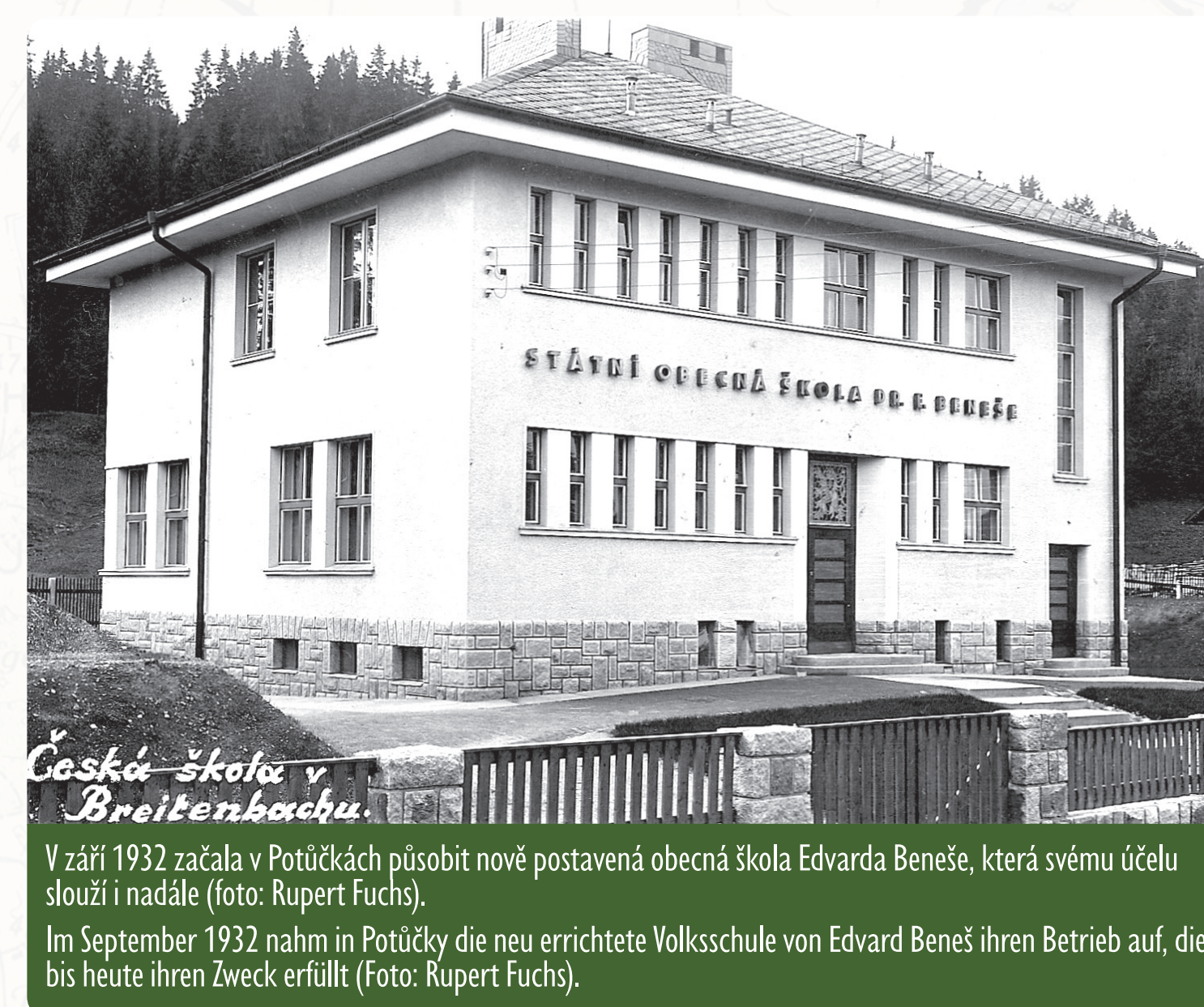
Česká škola v Breitenbachu.