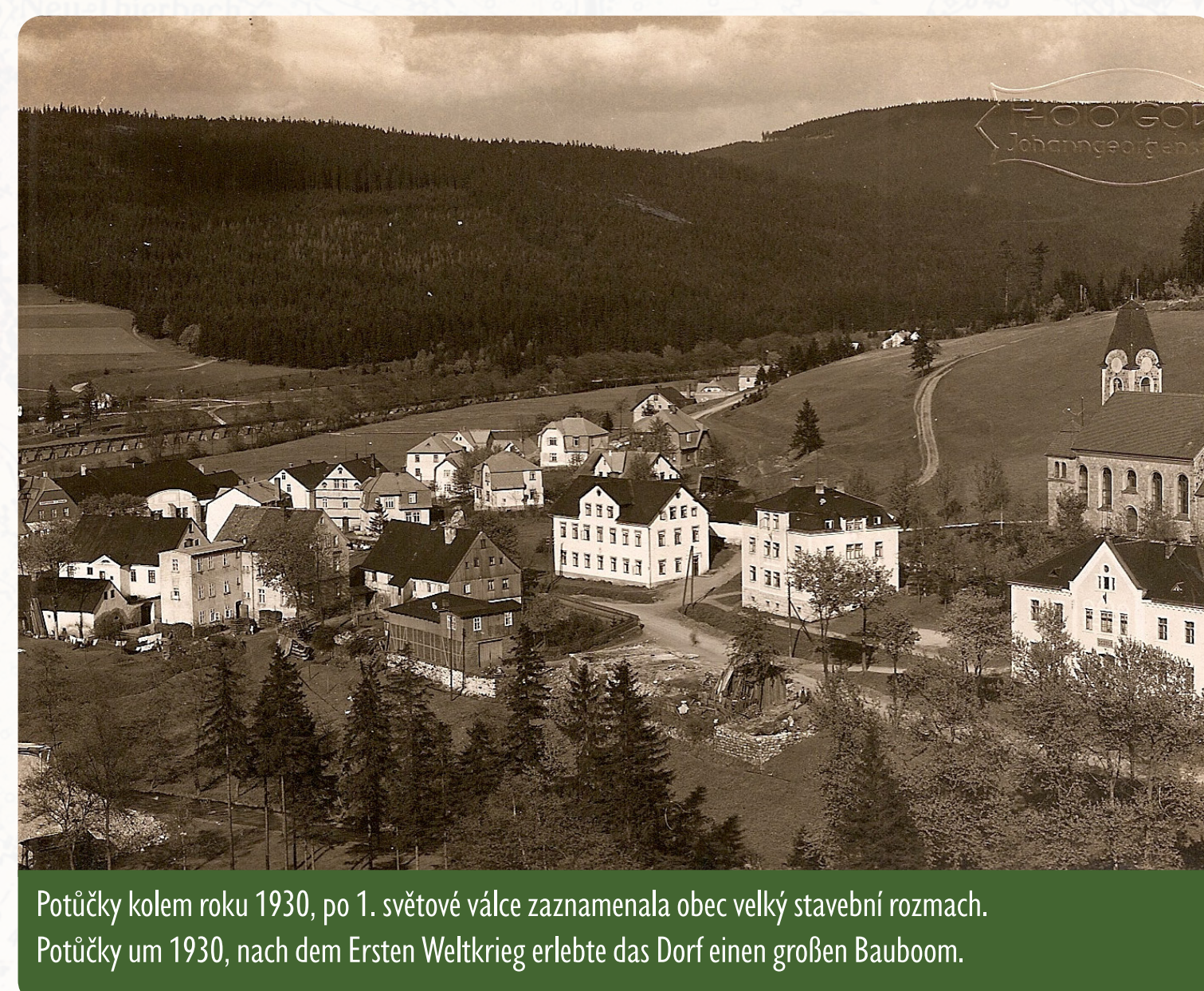
Potůčky kolem roku 1930, po 1. světové válce zaznamenala obec velký stavební rozmach.