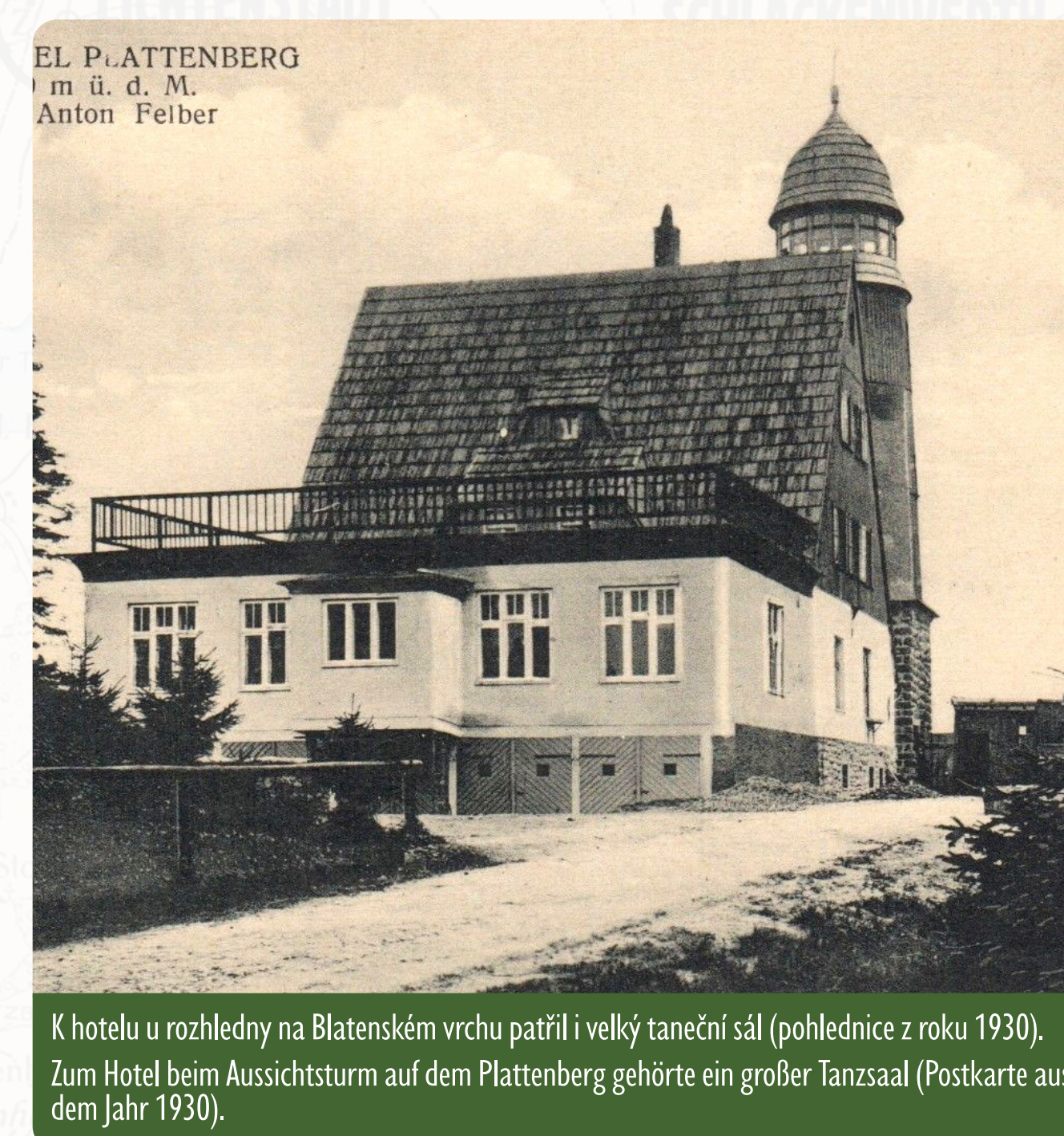
EL PLATTENBERG m. ü. d. M. Anton Feiler K hotelu u rozhledny na Blatenském vrchu patřil i velký taneční sál (pohlednice z roku 1930). Zum Hotel beim Aussichtsturm auf dem Plattenberg gehörte ein großer Tanzsaal (Postkarte aus dem Jahr 1930).