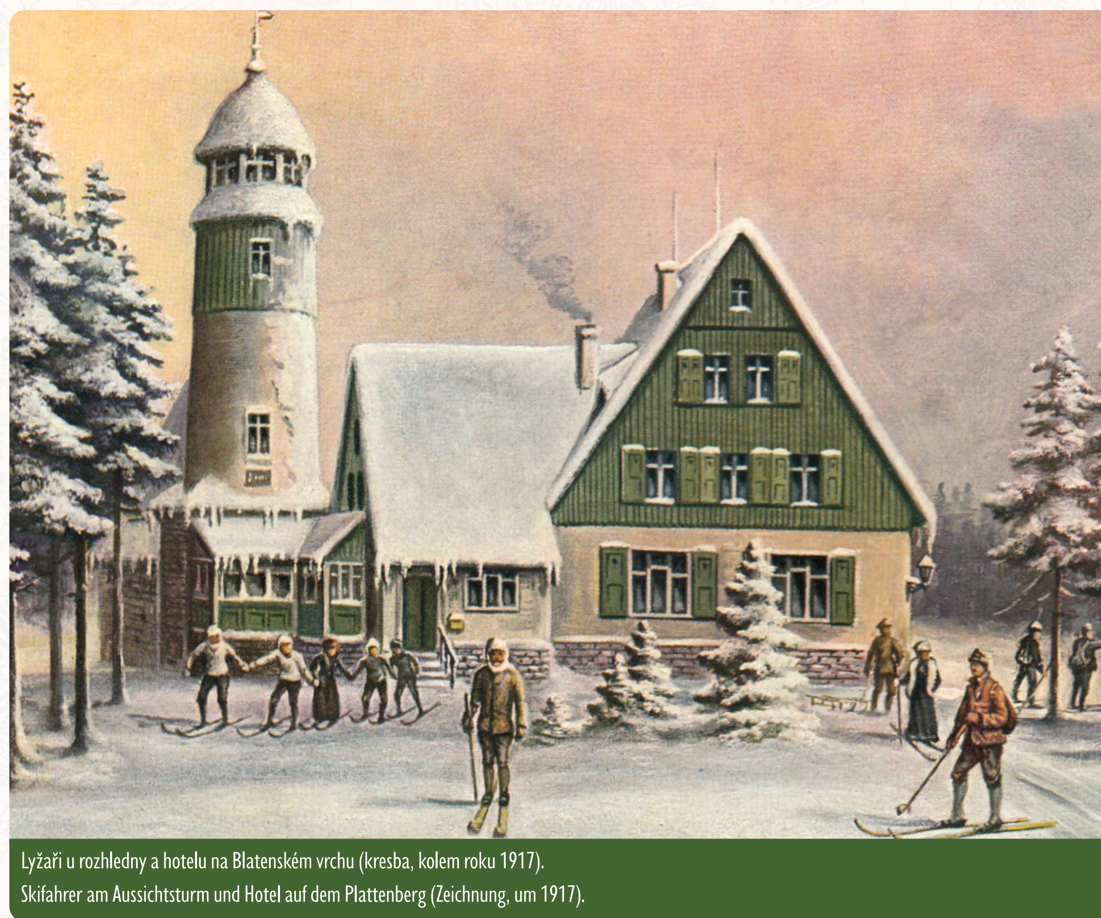
Lyžaři u rozhledny a hotelu na Blatenském vrchu (kresba, kolem roku 1917). Skifahrer am Aussichtsturm und Hotel auf dem Plattenberg (Zeichnung, um 1917).

Dnes již zapomenutou zajímavostí byly dvě sáňkařské dráhy z Blatenského vrchu, které byly otevřeny současně s první turistickou chatou v roce 1911. Jedna vedla lesem a poté po louce ke škole v Horní Blatné, druhá, strmější, směrem k severozápadu k Blatenskému vodnímu příkopu, významné technické a zároveň národní kulturní památce z let 1540–1544, která je od této zastávky vzdálena pouze 400 m po žluté turistické značce do Horní Blatné.