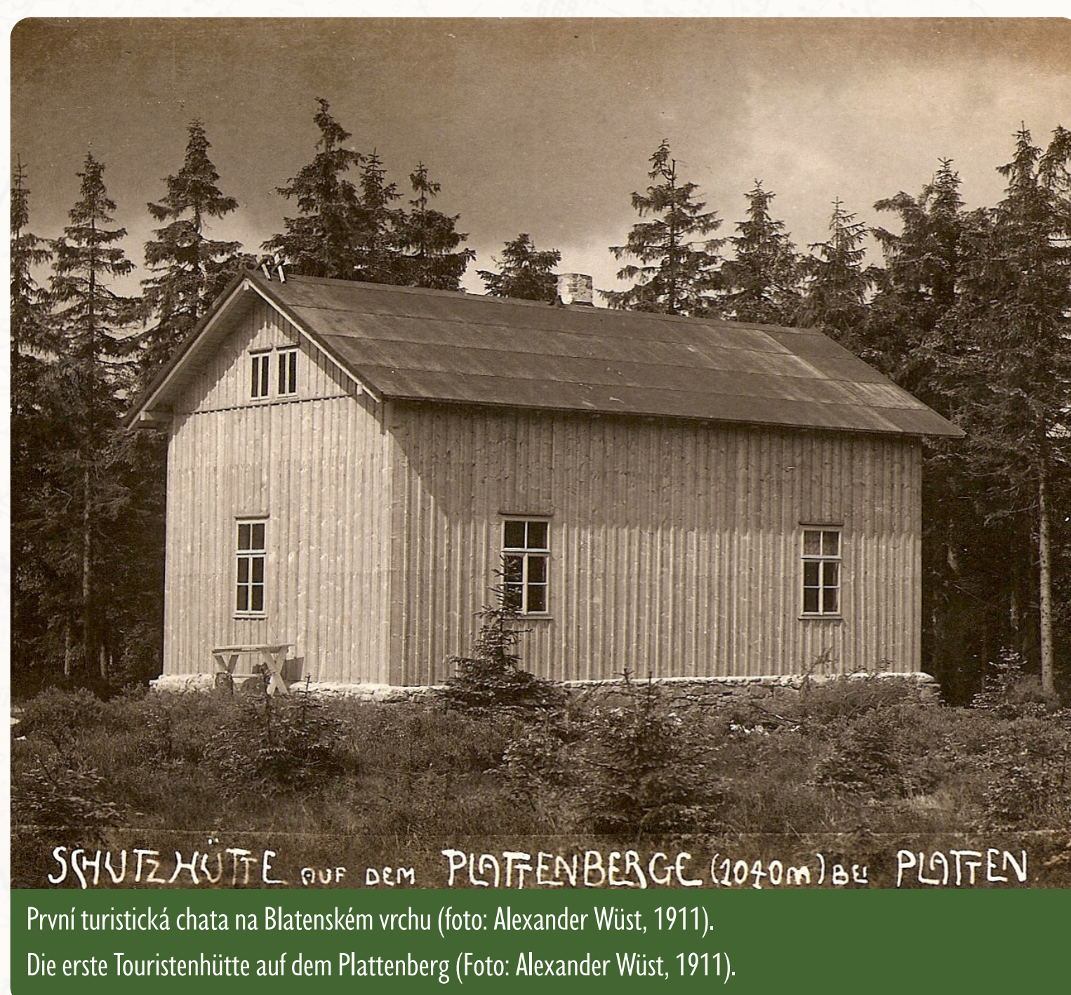
SCHUTZHÜTTE AUF DEM PLATTENBERG (1040 m) BEI PLATTEN První turistická chata na Blatenském vrchu. Die erste Touristenhütte auf dem Plattenberg.

Eine heute vergessene Attraktion waren zwei Rodelbahnen vom Plattenberg, die gleichzeitig mit der ersten Touristenhütte im Jahr 1911 eröffnet wurden. Die eine führte durch den Wald und dann über die Wiese zur Plattner Schule, die steilere in Richtung Nordwesten bis zum Plattner Erbwassergraben, dem bedeutenden technischen und zugleich nationalen Kulturdenkmal aus den Jahren 1540–1544, welches von dieser Station nur 400 m entfernt ist, wenn man dem gelben Touristenschild nach Horní Blatná folgt.