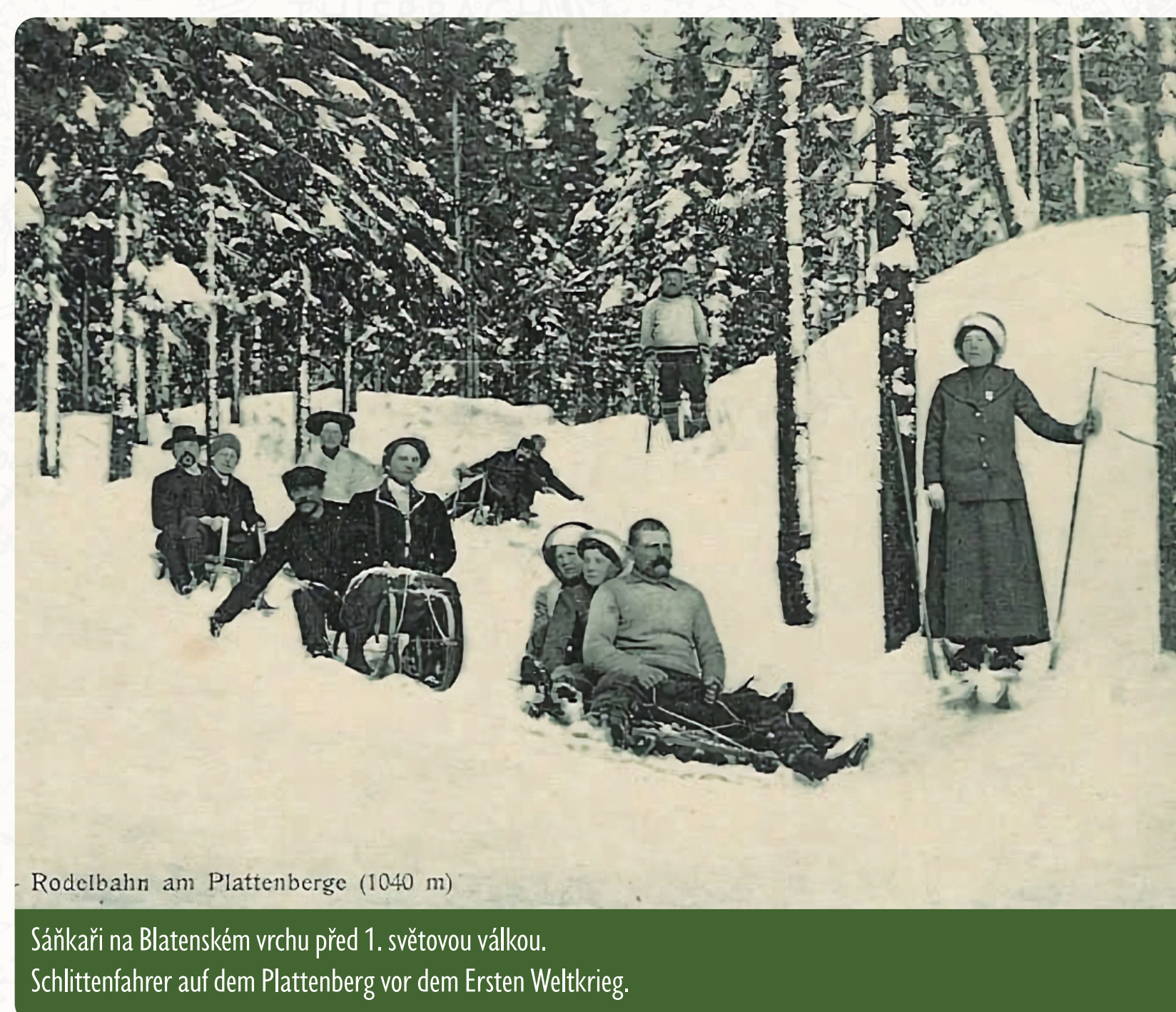
Rodelbahn am Plattenberge (1040 m) Sáňkaři na Blatenském vrchu před 1. světovou válkou. Schlittenfahrer auf dem Plattenberg vor dem Ersten Weltkrieg.