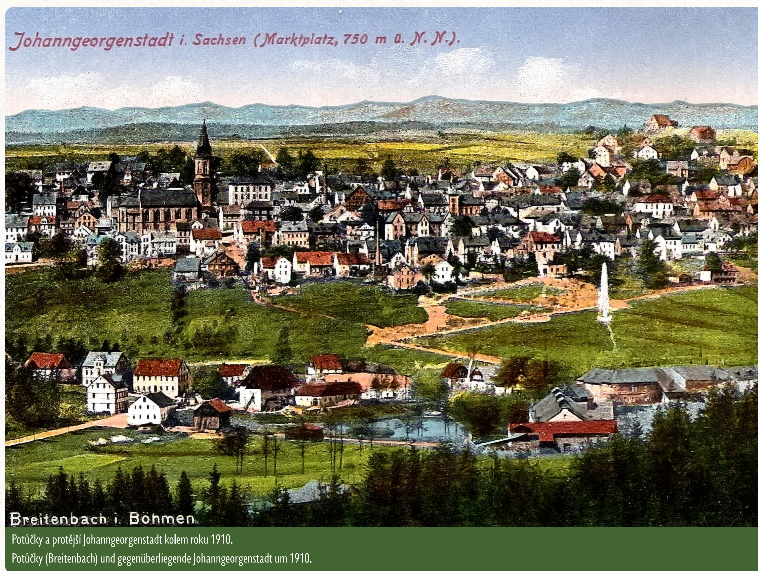
Johanngeorgenstadt i. Sachsen (Marktplatz, 750 m n. l.).

Obyvatelé Potůček a Johanngeorgenstadtu, přestože je dělí jen nevelký potok, neměli po 2. světové válce až do roku 1991 k sobě přístup. Státní hranice byla i kvůli těžbě uranu na obou stranách až do 60. let přísně střežena. Na české straně bylo už krátce po válce vyhlášeno bezpečnostní pásmo s omezeným vstupem, před hranicí byl vysekán ještě zhruba 15 m široký hraniční průsek s pozorovacími věžemi. Jeho některé části jsou dosud patrné, naučná stezka sleduje průběh průseku až k zastávce č. 3 na vrchu Rudná.