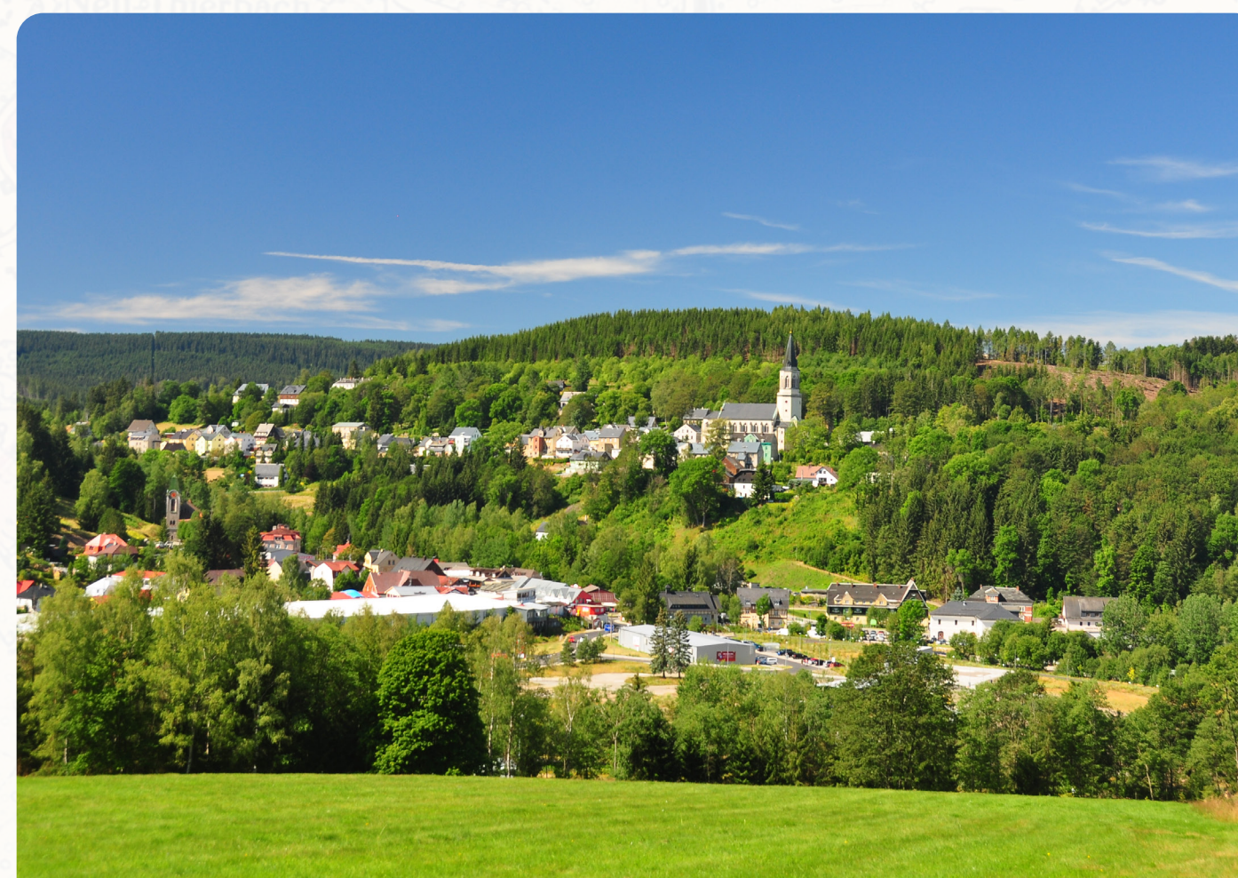
Díky rozsáhlému vládnímu sanačnímu programu po roce 1989 už dnes haldy u uranových šachet v Johanngeorgenstadtu téměř splývají s okolím. Dank des umfangreichen Sanierungsprogramms des Bundesregierung nach 1989 fügen sich die Uranhalden in Johanngeorgenstadt heute nahezu in ihre Umgebung ein.