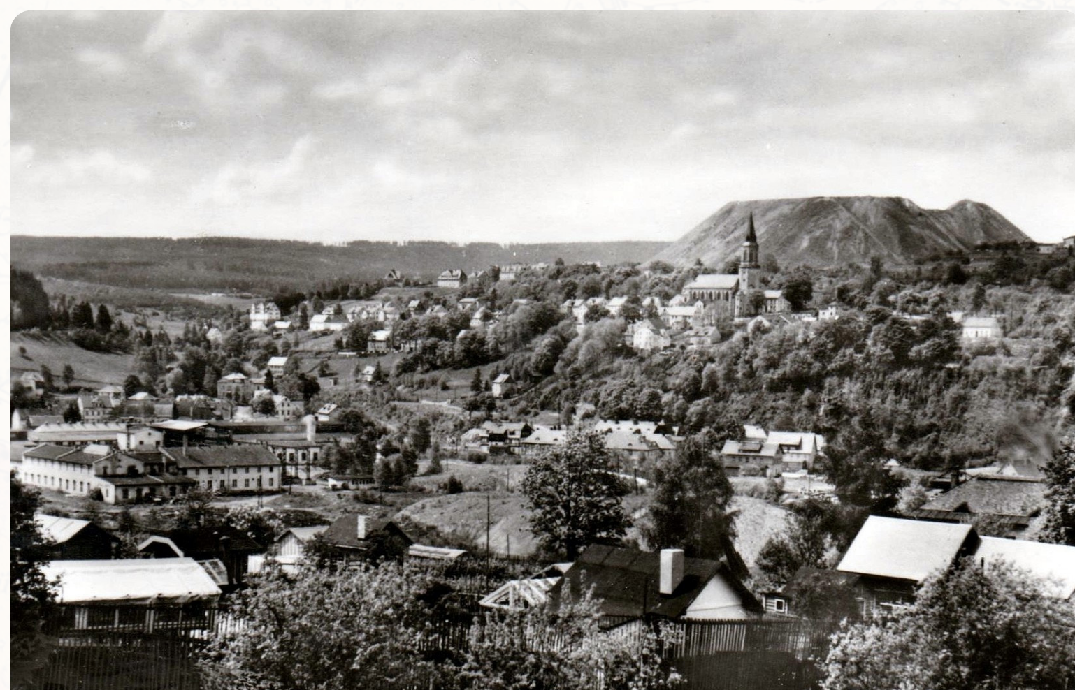
Kvůli těžbě uranu po 2. světové válce byla velká část Johanngeorgenstadtu zbourána, město téměř zasypaly obří haldy hlíny. Wegen des Uranabbaus nach dem Zweiten Weltkrieg wurde ein großer Teil von Johanngeorgenstadt abgerissen. Die Stadt war fast von riesigen Abraumhalden zugeschüttet.

Die Einwohner von Potůčky und Johanngeorgenstadt hatten nach dem Zweiten Weltkrieg bis 1991 keinen Zugang zueinander, obwohl sie nur durch einen kleinen Bach getrennt waren. Auch die Staatsgrenze wurde aufgrund des Uranabbaus bis in die 1960er Jahre auf beiden Seiten streng bewacht. Auf tschechischer Seite wurde kurz nach dem Krieg eine Sicherheitszone mit beschränktem Zutritt ausgerufen und vor der Grenze eine etwa 15 m breite Schneise mit Wachtürmen geschaffen. Einige Teile davon sind noch sichtbar. Der Lehrpfad folgt dem Verlauf der Schneise bis zur Haltestelle Nr. 3 auf dem Hügel Rudná (Glücksburg).