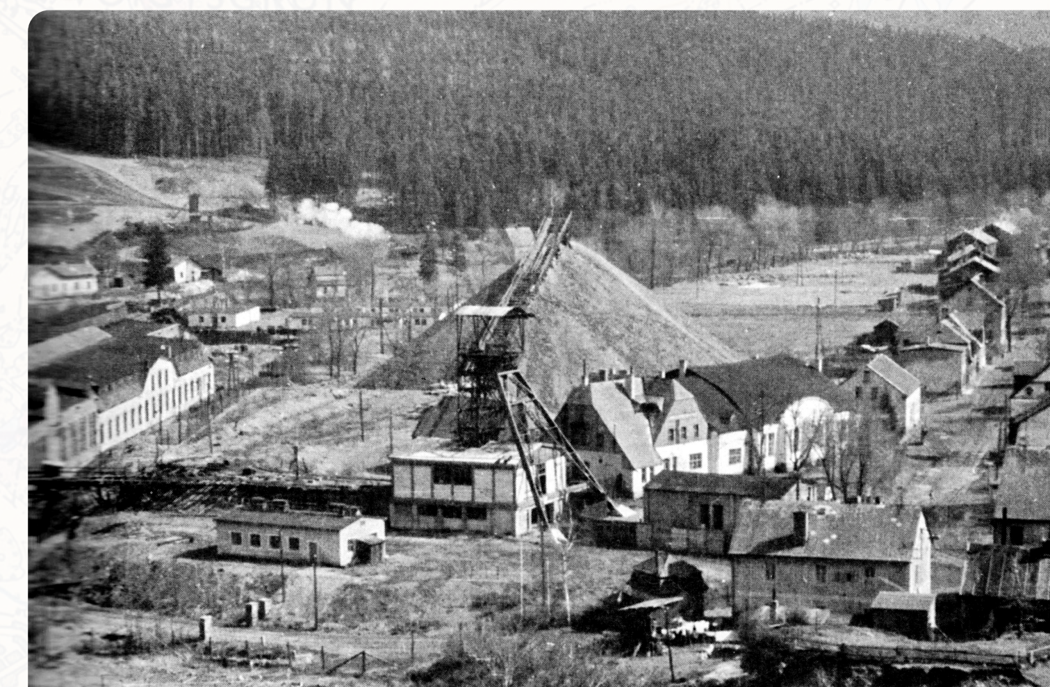
Také Potůčky byly v 50. a 60. letech významně postiženy těžbou uranu, na snímku těžní věž a kuželovitá halda dolu Magdalena ve středu obce, vlevo někdejší slévárna. Auch Potůčky war in den 1950er und 1960er Jahren maßgeblich vom Uranabbau betroffen. Im Bild der Förderturm und die kegelförmige Halde der Grube Magdalena in der Ortsmitte, links die ehemalige Gießerei.