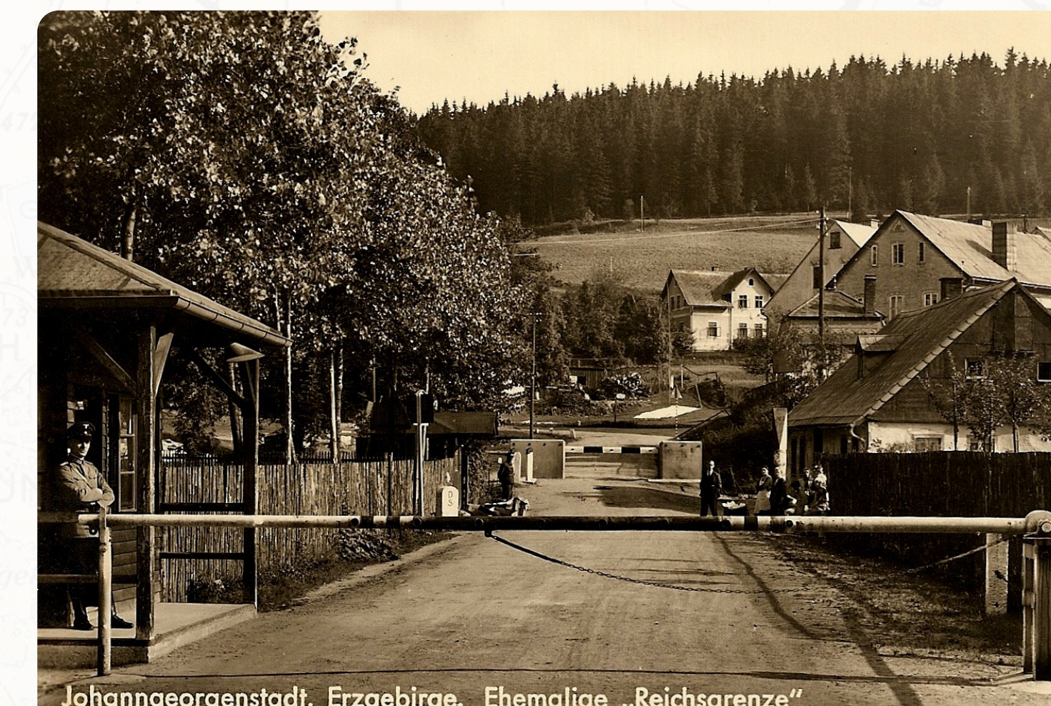
Johanngeorgenstadt, Erzgebirge. Ehemalige „Reichsgrenze“ Zátaras na česko-německé hranici v Potůčkách před zánem Sudet v říjnu 1938, z říšské hranice se poté stala hranice vnitrostátní. Straßensperren an der tschechisch-deutschen Grenze in Potůčky vor der Besetzung des Sudetenlandes im Oktober 1938, die Reichsgrenze wurde dann zur Landesgrenze.